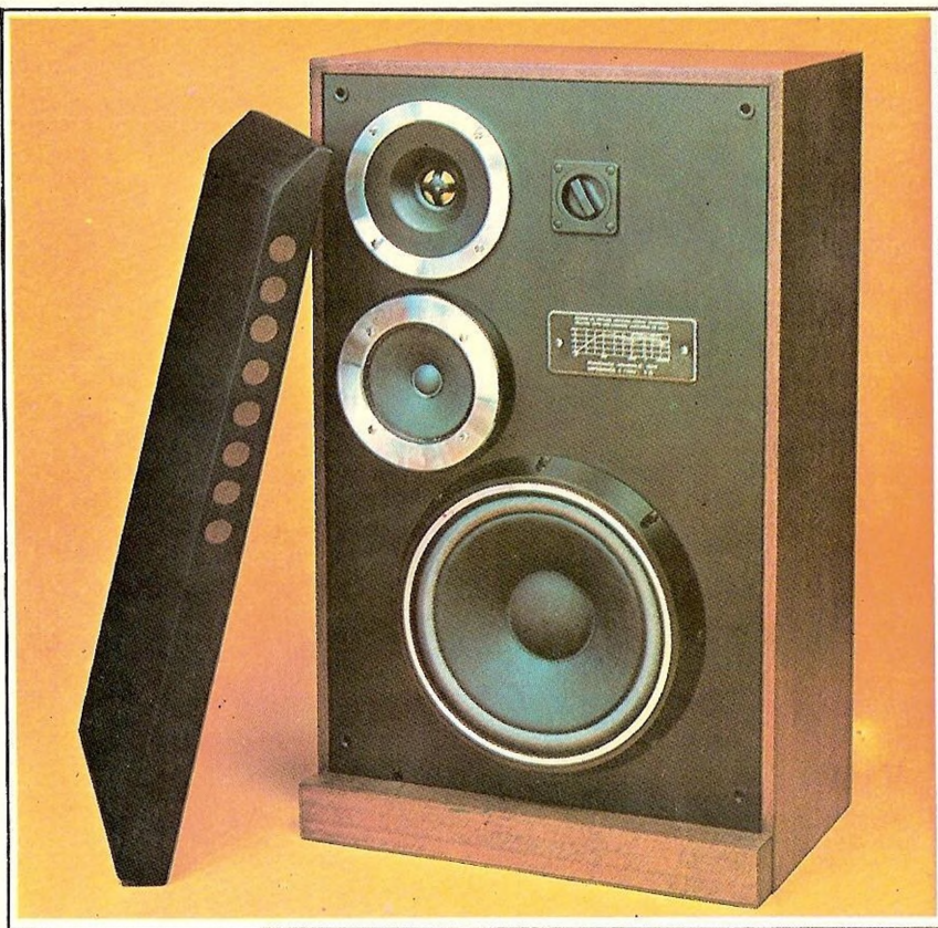
ZG 60C 11